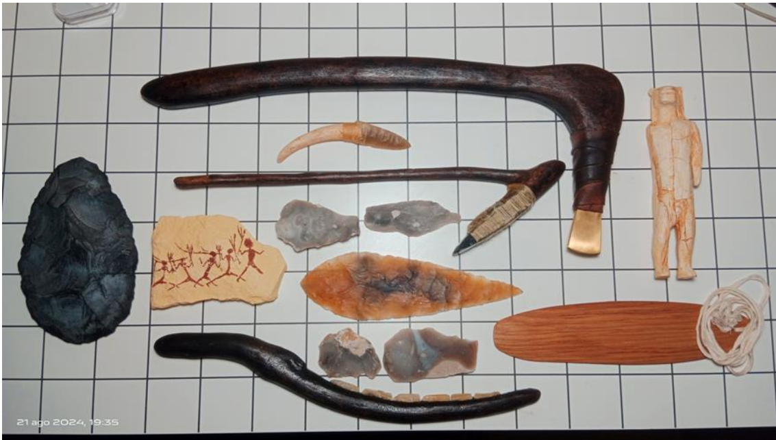
Ilustración 3. Réplicas arqueológicas incorporadas al Civillalar