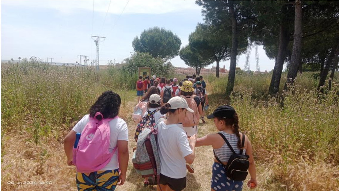
Ilustración 5. Escolares visitando el itinerario de polinizadores

En resumen, 2024 fue un año de intensa actividad, donde estudiantes, profesionales y niños de todas las edades se acercaron a GREFA para conocer nuestros proyectos y colaborar en la conservación de la naturaleza.