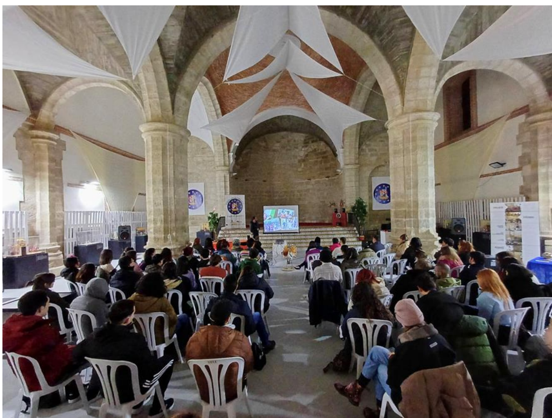
Ilustración 1. Estudiantes universitarios participando en uno de los foros

Operación Polinizador: Nuestra campaña "Operación Polinizador" movilizó a más de 5.000 personas en la fiesta de la Comunidad Autónoma de Castilla y León, quienes plantaron cerca de 6.000 arbustos de interés melífero para favorecer a nuestros insectos polinizadores.