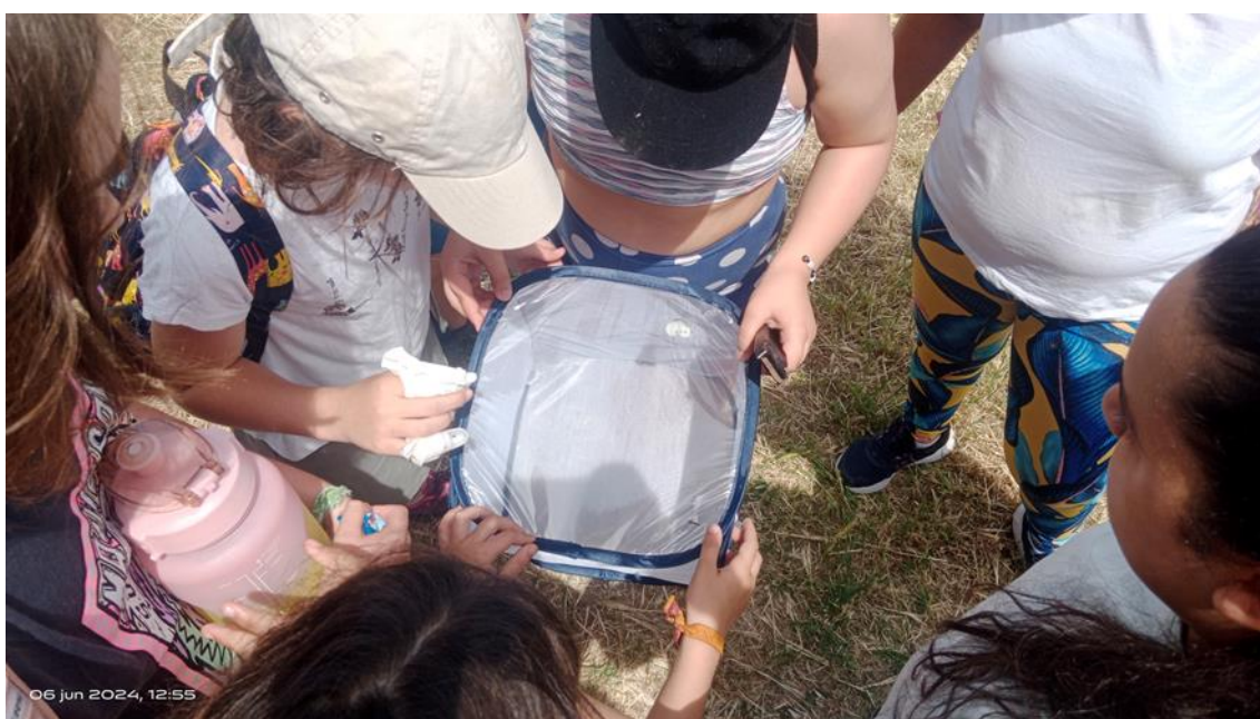
Ilustración 2. Escolares observando una mariposa antes de liberarla

Al incorporar los insectos polinizadores a nuestro programa educativo, hemos conseguido enriquecerlo, a la vez de hacerlo más divertido y participativo. Además del mural de los polinizadores, tenemos una pequeña senda interpretativa donde en los meses más cálidos del año, los visitantes nos acompañan buscando mariposas, escarabajos florícolas, abejas y otros muchos polinizadores.