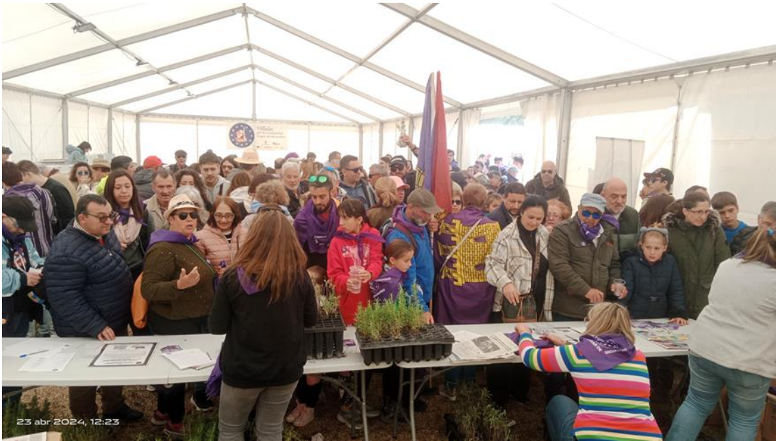
Ilustración 4. Participantes de la Operación Polinizador Villalar 2024