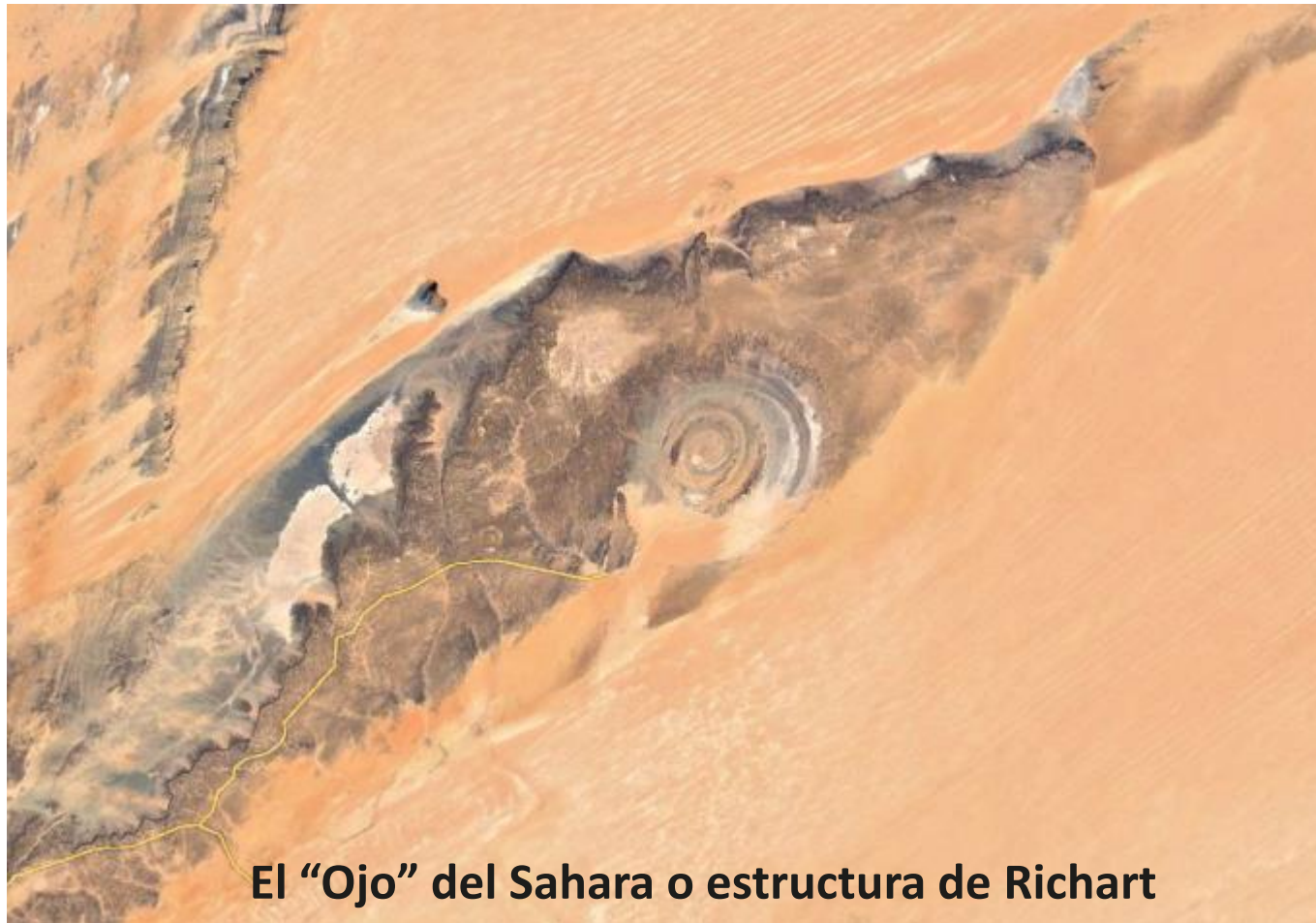
El "Ojo" del Sahara o estructura de Richart

A vista de pájaro, o vista a vuelo de pájaro, o vista aérea es una vista de un objeto desde arriba, "en planta" o en vertical desde el observador, muy usada por ejemplo en los mapas.