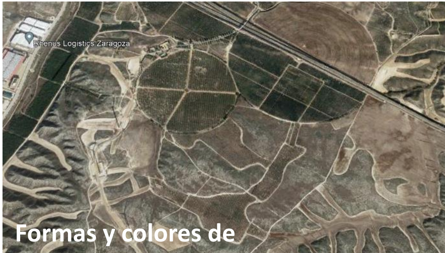
Formas y colores de campos de cultivo