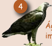
Águila imperial ibérica