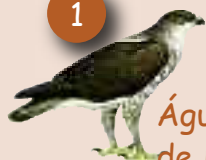
Águila de Bonelli