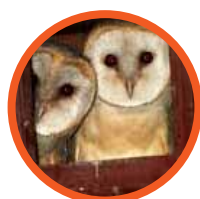
Caja nido de lechuzas

Desde GREFA se trabaja en el control biológico de plagas: se introducen aves rapaces en zonas apropiadas y se les facilita refugio donde no lo tienen. Nuestras dos especies estrella en el control de plagas son: Lechuzas y cernícalos.