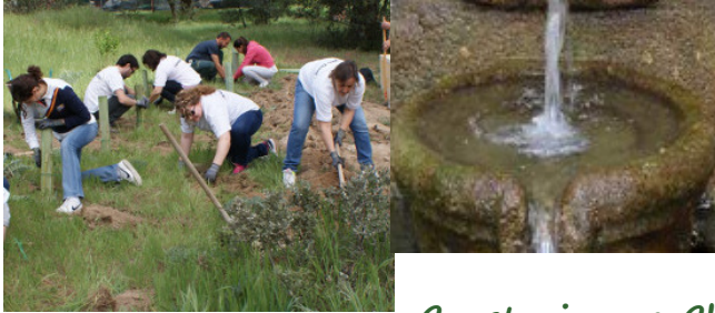
Construir una Charca.

El primer paso es obvio: disponer de un espacio adecuado (y en su caso con permisos) para poder llevar a cabo esta actuación que nos ayudará a fomentar la biodiversidad.